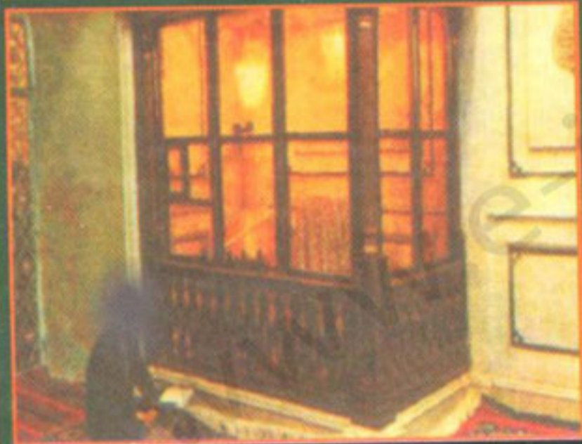
حضرت حسینؑ کا سر مبارک دمشق میں دفن ہے