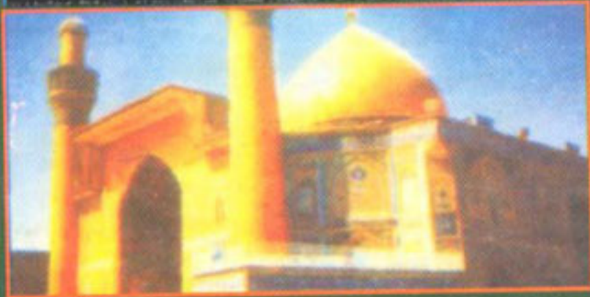
نجف اشرف (عراق) میں امیر المؤمنین حضرت علی رضی اللہ عنہ کا روضہ مبارک