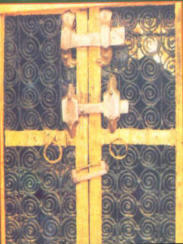
والدہ ماجدہ حضرت حسینؑ سیدہ فاطمہ رضی اللہ عنہا کے گھر کا دروازہ