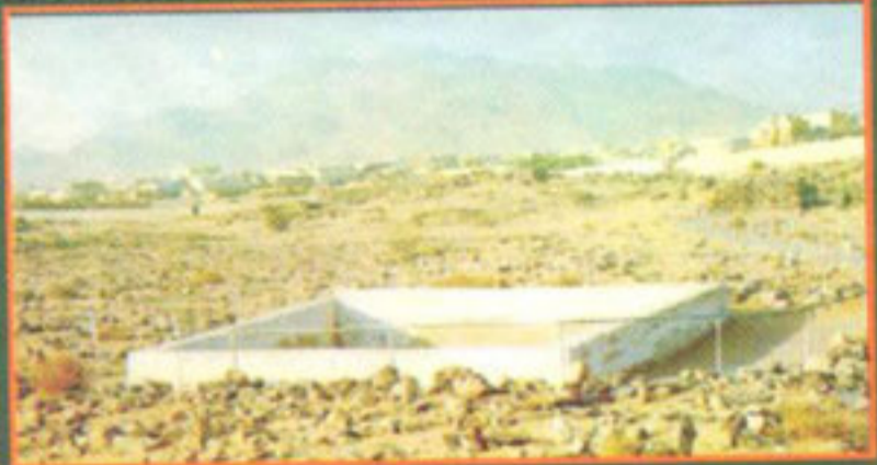
اس چار دیواری میں سید الشہداء حضرت حمزہ رضی اللہ عنہ کا جائے مدفون ہے

چوک فوارہ ملتان ان پکٹمان فون: 4540513-4519240